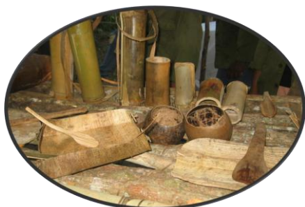
Figura No 4.

exploradores, contenidos en los requisitos para obtener las categorías “explorador mambí”, “explorador rebelde” y “explorador de la victoria” en la educación primaria. Los ejemplos que se muestran en las figuras No 4 y 5, así lo atestiguan.