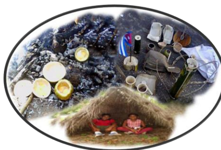
Figura No 5.

Fig. No 4. Objetos rústicos confeccionados por los pioneros exploradores durante una actividad de capacitación en la Isla de la Juventud.