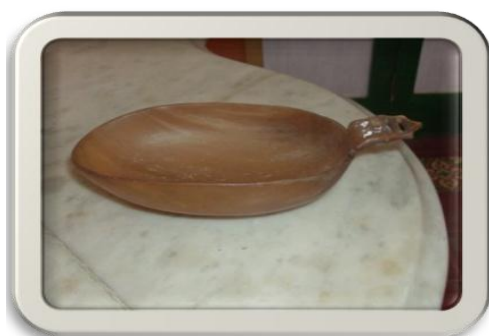
Fig. No 7.

Todo lo antes expresado son patrimonio del MPE para las actividades de supervivencia que realizan en la actualidad, pero que su génesis está en las heroicas proezas del pueblo cubano por su independencia nacional. Las figuras No 7 y 8, que les continúan explicitan lo antes expresado.