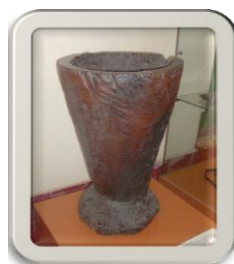
Figura No 1.

Desde esta perspectiva, en la lucha de los cubanos contra el colonialismo español; en su capacidad para imponerse al sufrimiento, las calamidades y la despiadada explotación a que fueron sometidos; unido a su ingenio y creatividad para resolver su situación económica, social y política, recogidos para la posteridad en documentos históricos, libros, diarios de campaña, revistas y materiales, es donde radican las fuentes a partir de las cuales se gesta el origen y autenticidad del MPE en Cuba. Así lo demuestran los ejemplos que a continuación se relacionan.