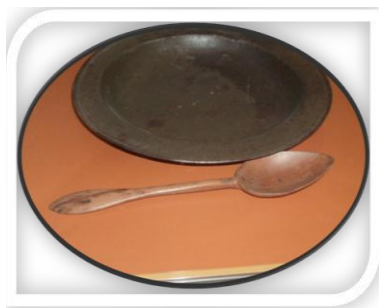
Figura No 2.

Otras de las aportaciones al MPE se evidencian con la creación de objetos rústicos para solucionar dificultades originadas en las calamidades de la guerra de manera creativa y resuelta o para comer y beber ante la falta de utensilios en condiciones de campaña. Los ejemplos que se muestran a continuación así lo revelan.