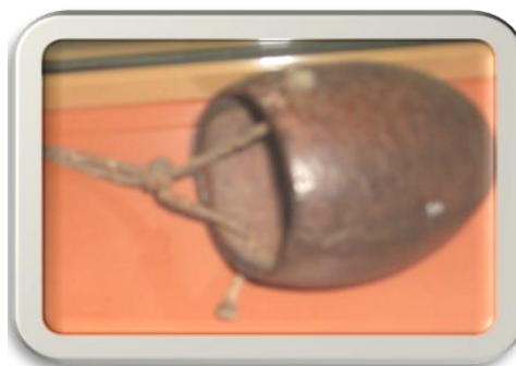
Fig. No. 8.

Fig. No 7. Jícara de güira cimarrona, perteneciente al General de Brigada Henry Reeve (1850-1859), durante la Guerra de los Diez Años.