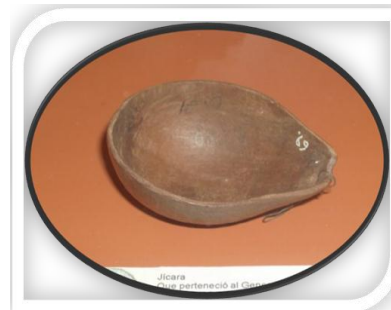
Figura No 3.

Figura No. 2 Plato y cuchara de madera, perteneciente al Dr. Dionisio Sáez García (1826-1898), cuando fue deportado a África.